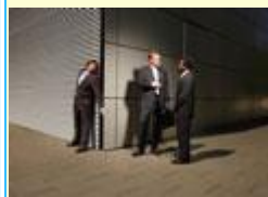
un coin. a corner