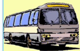
a coach. un (auto)car