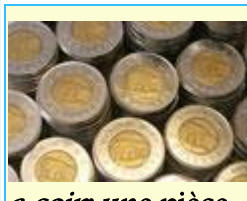
a coïr. une pièce de monnaie