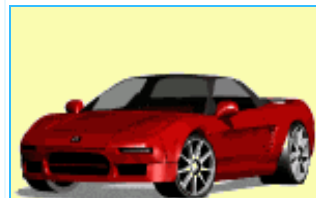
a car. une voiture