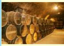
une cave. a cellar