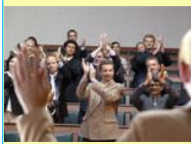
a lecture. une conférence