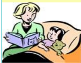
la lecture. reading