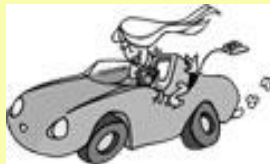
conducteur. car driver