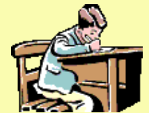
to take an exam to sit for an exam. passer un examen