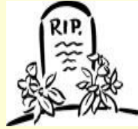
a grave. une tombe