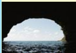
a cave. une grotte