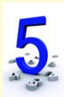
a figure. un chiffre