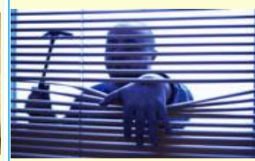
un store. a blind