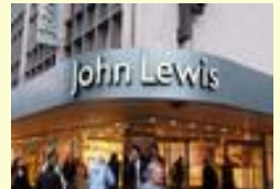
a store. magasin