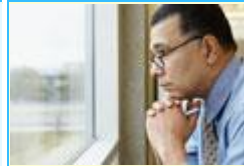
grave. serious (adj.)