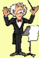
conductor. contrôleur (bus) chef d'orchestre