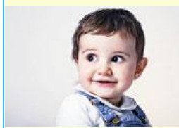
une figure. a face